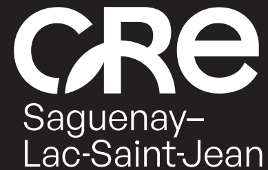
Logo noir et blanc version horizontale